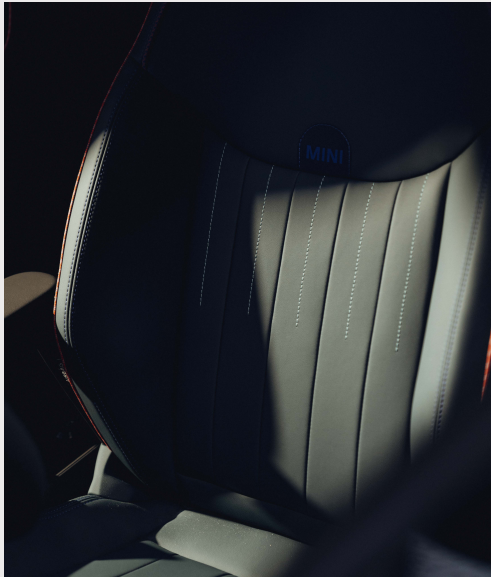
JCW: Asientos deportivos de piel sintética en combinación con tela con diseño exclusivo JCW. SE: Asientos deportivos de piel sintética. E: Asientos de piel sintética en combinación con tela.

*Combinación de techo dependiendo del color de carrocería.