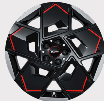
19" John Cooper Works Strive Spoke 2-tone.