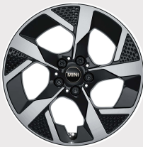
Rin 18" Slide Spoke 2-tone.