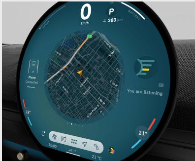
Unidad interactiva MINI. Pantalla central OLED con un área de 440 cm2.