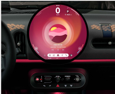
MINI Experience Modes: Go Kart, Green, Core, Personal, Timeless, Vivid, Balance.

Garantía (5) por 3 años o 200,000 km, lo que ocurra primero. Mantenimiento Total MINI (6) por 4 años sin límite de kilómetros.