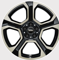
Rin 19" Hexagram Spoke 2-tone.