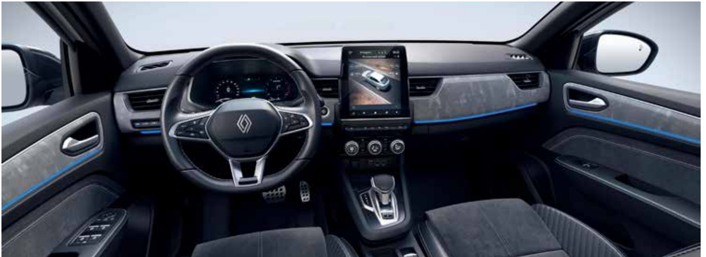
esprit Alpine (techno +)