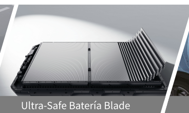
Ultra-Safe Batería Blade