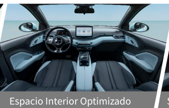
Espacio Interior Optimizado