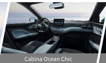
Cabina Ocean Chic