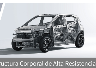
Estructura Corporal de Alta Resistencia