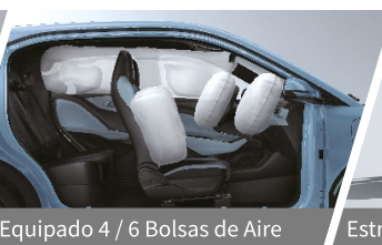
Equipado 4 / 6 Bolsas de Aire