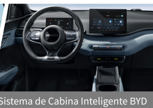
Sistema de Cabina Inteligente BYD