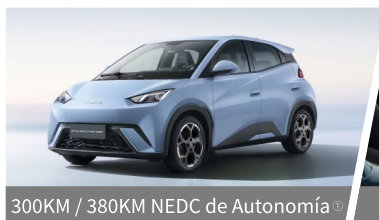
300KM / 380KM NEDC de Autonomía ①

HATCHBACK 100% ELÉCTRICO INTELIGENTE, EFICIENTE Y DIVERTIDO