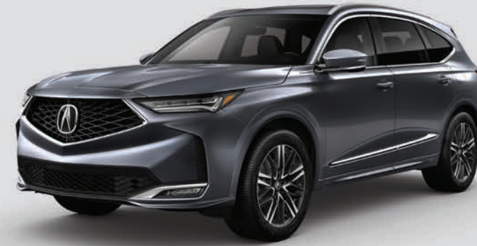
Exterior: Grafito Interior: Mocha