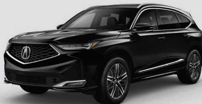
Exterior: Negro Supremo Interior: Mocha