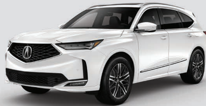
Exterior: Blanco Platino Interior: Negro / Mocha