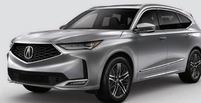
Exterior: Plata Lunar Interior: Mocha