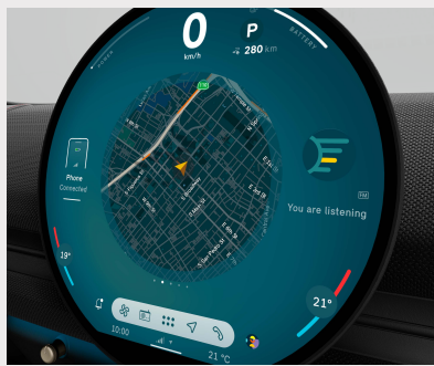
Unidad interactiva MINI. Pantalla central OLED con un área de 440 cm 2 .