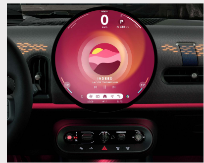
MINI Experience Modes: Go Kart, Green, Core, Personal, Timeless, Vivid, Balance.