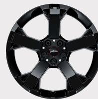
Rin 19" John Cooper Works Runway Spoke Black.