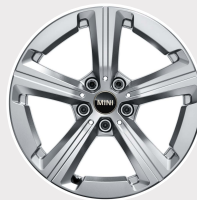
Rin 17" Spoke Grey.