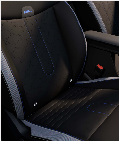
JCW: Asientos deportivos de piel sintética en combinación con tela con diseño exclusivo JCW. C / S: Asientos de piel sintética en combinación con tela.