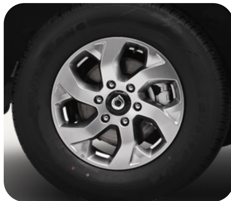
Rines de aluminio 17"