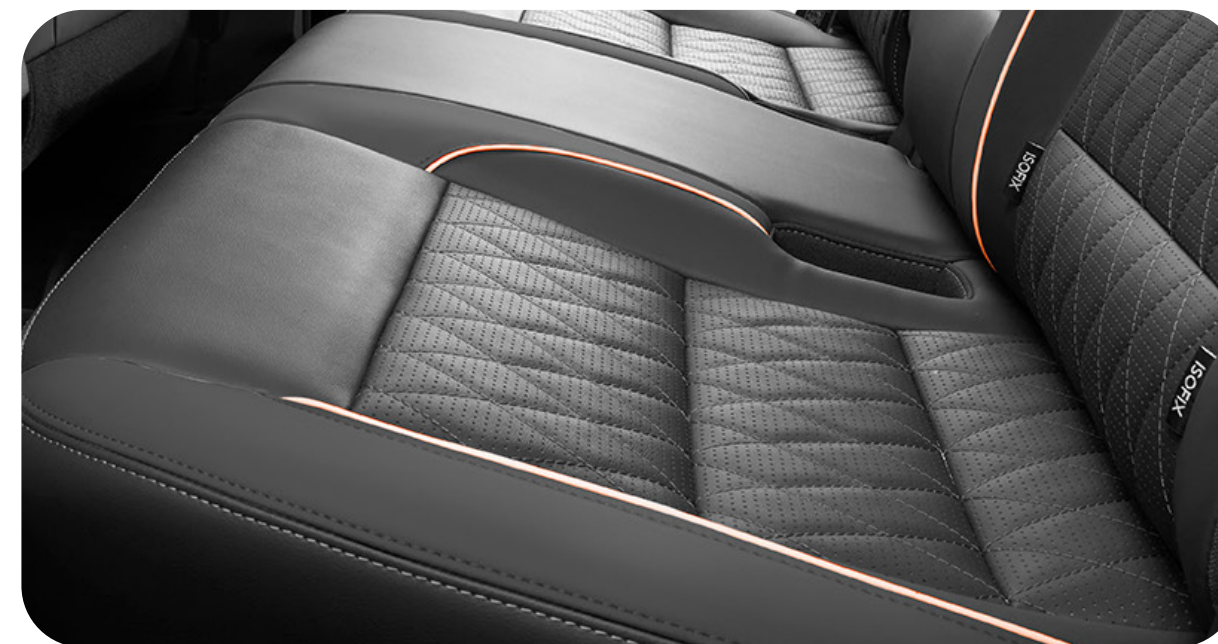
Vestiduras de piel / Negro