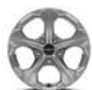
Rin de aluminio 16" 205/65R17 EX