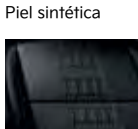
Negro, un tono EX PACK, SX, SXL