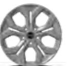
Rin de aluminio 17" 215/60R17 EX PACK, SX