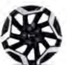
Rin de aluminio bitono 17" 215/60R17 SXL